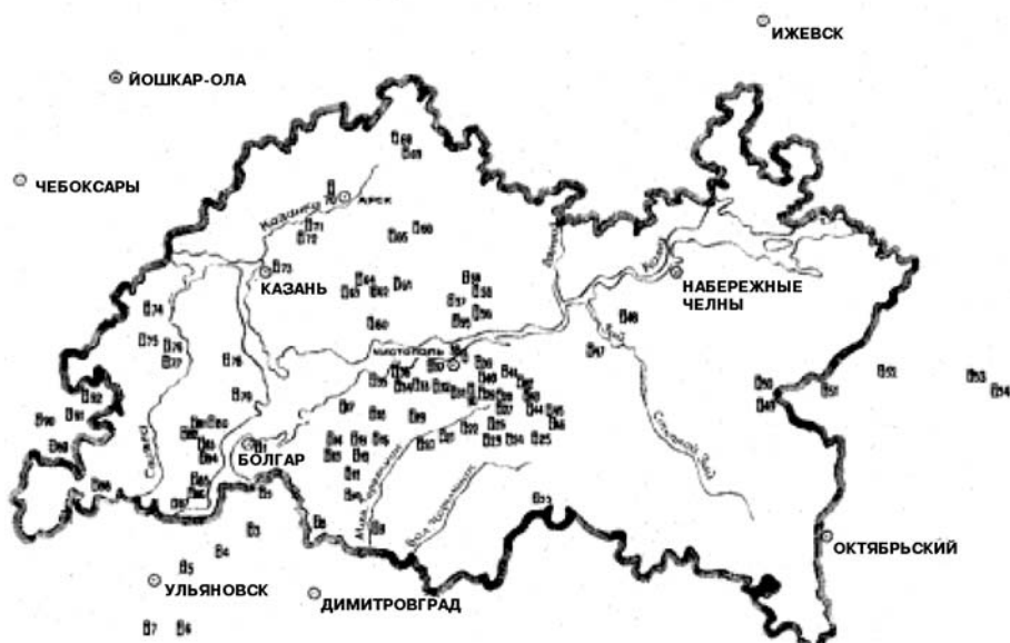
Рис. 1. Памятники XIII — XIV вв. [5, с. 75]

Подробный анализ надмогильных надписей Поволжья [6; 7; 16] в своих последних работах дал Мухаметшин [5]. Он исследовал около 900 эпитафических памятников, созданных с XI в. по первую треть XX в. Хронологически он выделил три периода: XIII — XIV вв., с XV до начала XVII в., со второй половины XVII до XX в. Из последнего периода — по расчетам автора — известны 700 эпитафий, встречающихся на современной территории Республики Татарстан севернее Камы [5, с. 61]. На 94 могильниках, датируемых с XV до начала XVII в., было найдено 250 надмогильных надписей, которые можно отнести к трем регионам: Казань, Касимов и Карино [5, с. 46]. Язык данных эпитафий, относящихся к двум из указанных периодов, определяется как предшественник татарского языка, т. е. как общетюркский язык.